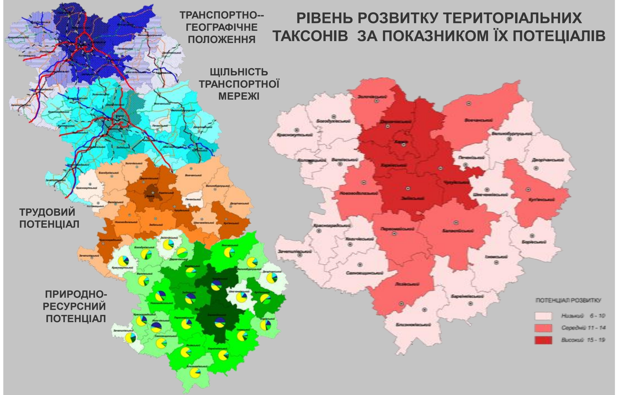
СХЕМА ПОБУДОВИ ІНТЕГРАЛЬНОГО ПОКАЗНИКА ПОТЕНЦІАЛУ